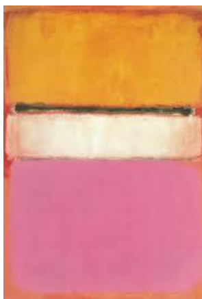
Marks Rotko, „Baltais centrs” (1950)

Saites ar vizuālu uzskates materiālu abstrakcionisma glezniecības tehnikās: